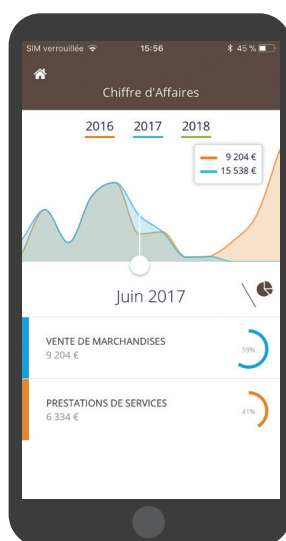
Aperçu en version mobile